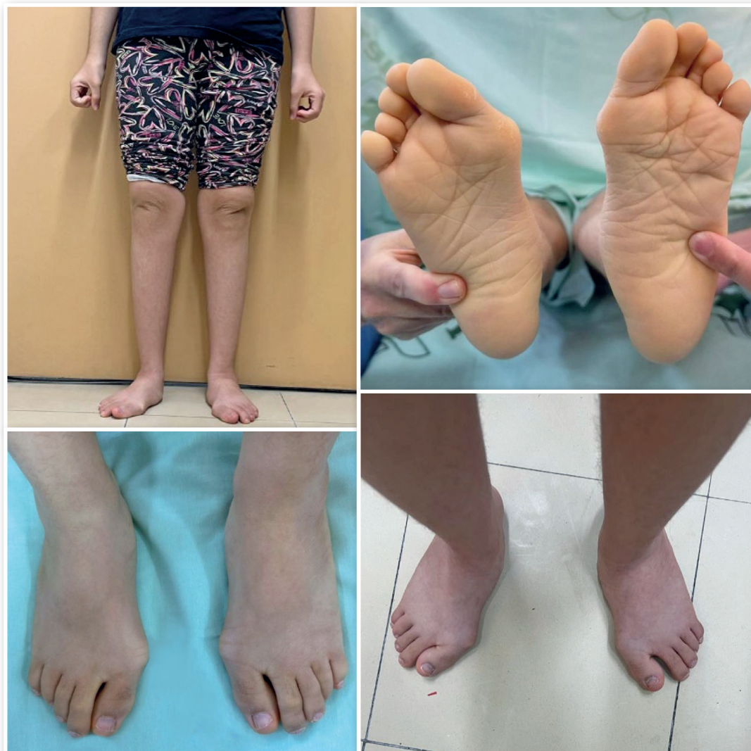
Figura 1. Aspecto clínico do pé direito e esquerdo pré-operatório.

correção do hálux valgo associada à reconstrução da estabilidade do primeiro raio, com a técnica combinada de Lapidus e osteotomia de Cotton (LapiCotton), e correção da hiperpronação com implante de parafuso subtalar (calcâneo stop).