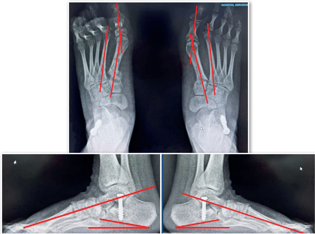
Figura 5. Radiografia em anteroposterior evidenciando os ângulos: intermetatarsal de 10° a direita e 11° a esquerda e ângulo do hálux valgo de 12° a direita e 14° a esquerda. No Perfil: Meary de 0° bilateral; Pitch do calcâneo: 12° do pé direito e 10° do pé esquerdo.

O uso da técnica do calcâneo stop mostrou-se eficaz para correção da hiperpronação, particularmente em pacientes com hiper mobilidade ligamentar, como na síndrome de Down. Este caso demonstrou boa correção anatômica e funcional, além de menor morbidade comparada a procedimentos mais invasivos.