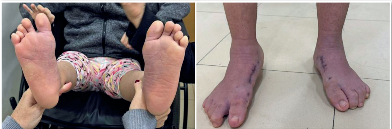
Figura 4. Aspecto clínico do pé esquerdo e direito após tratamento cirúrgico.

Estudos também comparam a eficiência biomecânica da técnica LapiCotton com vários tipos de enxertos para a correção do hálux valgos associados ao pé plano. Resultados indicam maior correção angular e estabilidade na técnica combinada em qualquer tipo de enxerto utilizado 6-8 .